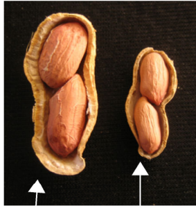
ジャンボ落花生 一般的な落花生