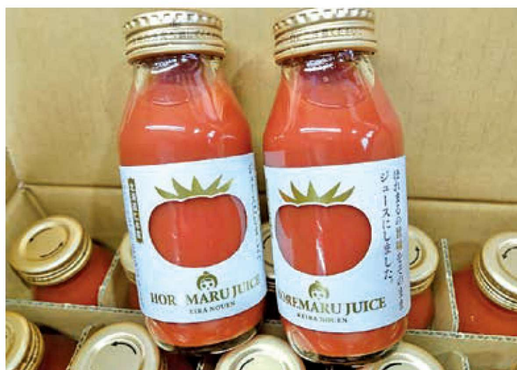
野菜ソムリエサミット加工部門で金賞受賞の「ほれまるジュース」