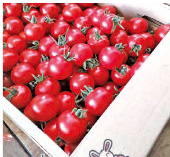
直売所で大人気の「ほれまる」

「ほれまる」は青果でも加工でもミニトマトを愛するすべての人に味わって頂きたい商品です。