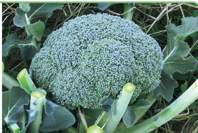
9月10日定植→撮影日12月14日 草姿立性、花蕾形状もドーム型でボリューム満点!