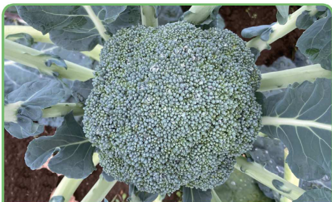
9月2日定植→撮影日11月7日 花蕾粒が細かく、ドームが綺麗