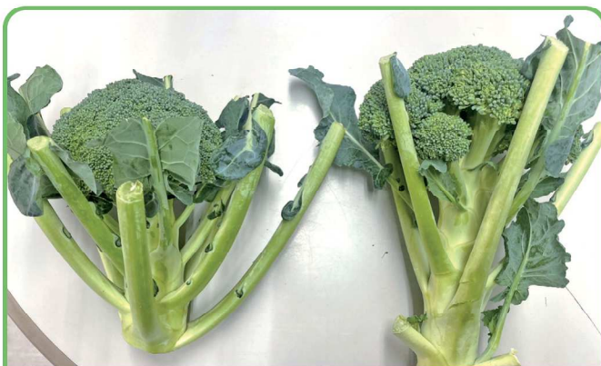
9月5日定植→撮影日11月20日 左:NX-BB304 右:他社品種