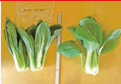
「ニイハオ・メイ」 他社品種

寸胴型で見た目はコンパクトだが、他社品種より葉柄の厚みがあり、葉枚数が多い。調整作業後の1株重が重く、高い歩留まりを確保することができた。