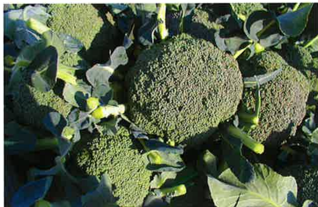
収穫された『NX-BB331』。花蕾の揃いが抜群。