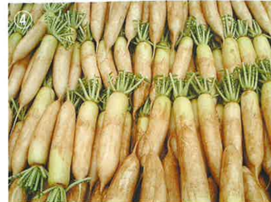
揃いが抜群の 冬岬