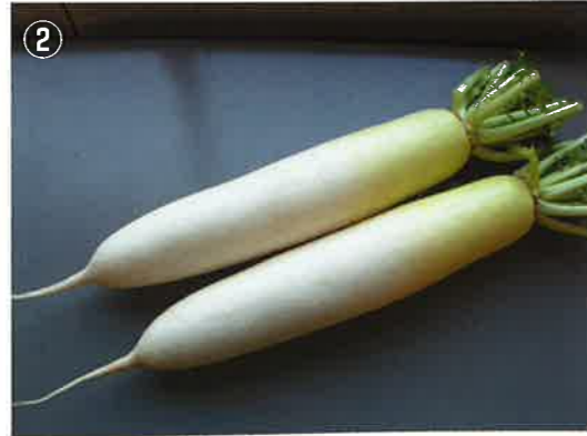
肌が強く、光沢があり、尻の詰りも良い