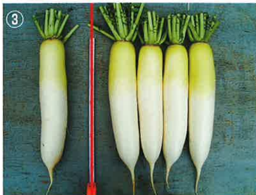
他社品種 F種 冬岬

冬岬は「揃い」「上品な肌質」の他に、首もとの汚れが少なく、肩が張り過ぎないので箱詰めしやすい。銚子地区では9月中旬~9月下旬播種まで使える。